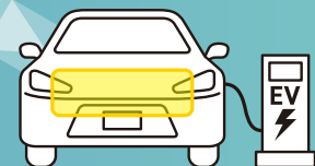
as an ACOUSTIC MATERIAL for an electric car 電気自動車の吸音マット