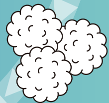
反毛 もう一度綿に