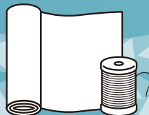
FELT YARN フェルト・糸に加工