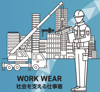
WORK WEAR 社会を支える仕事着